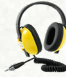
Headphone tahan air

Headphone EQUINOX 3,5mm (1/8 inci) kedap air